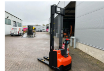
TOYOTA Werksüberholt / Factory refurbished