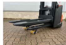
TOYOTA Werksüberholt / Factory refurbished