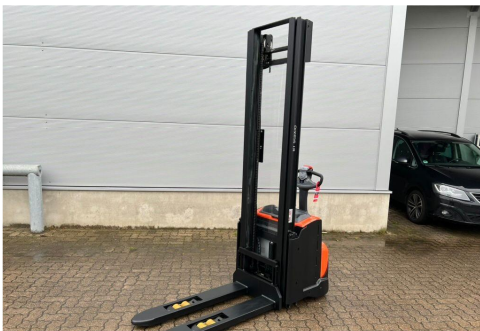
TOYOTA Werksüberholt / Factory refurbished

We expressly point out that the above statements on the device do not represent any warranted characteristics. These are to be inquired directly with the responsible salesman in our house. However, only the information/properties according to the content of the purchase contract are ultimately relevant.