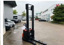
TOYOTA Werksüberholt / Factory refurbished

Price: 5.950,00 € (excl. VAT.) (Subject to prior sale)