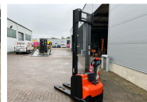
TOYOTA Werksüberholt / Factory refurbished